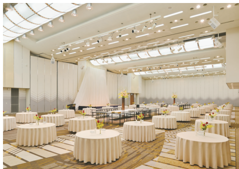
コンベンションホール「淡海」